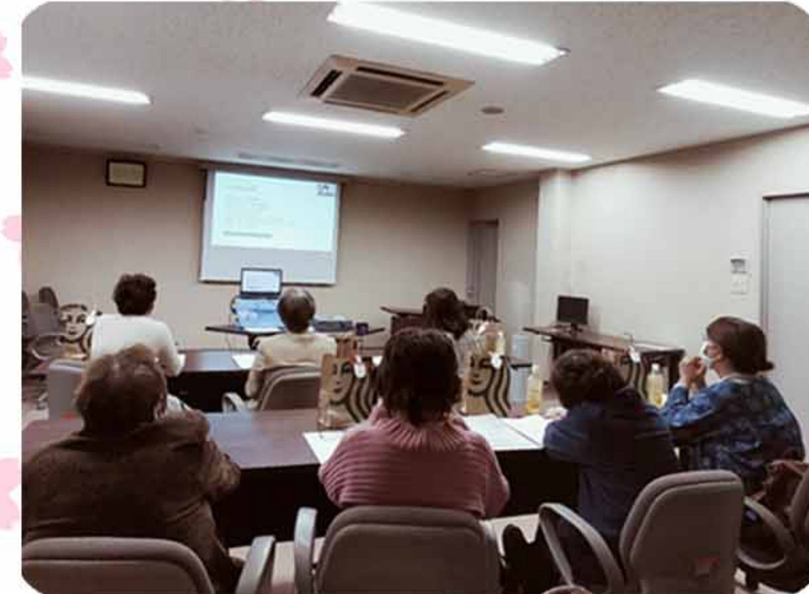
備南地域女性連主張発表（Zoom）