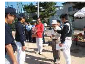
アキバ建設(優勝) 表彰式

当日は矢野町商工会のソフトボール大会史上(昭和50年から開催)初めての珍事がありました。それは決勝の結果が同点、