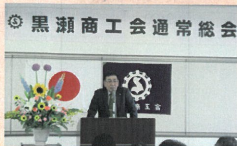
挨拶される大田会長