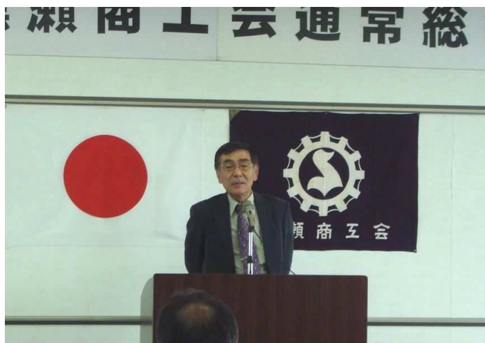
挨拶される大田新会長