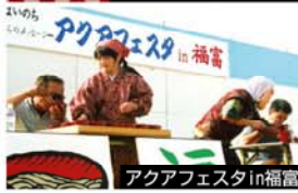
アクアフェスタin福富