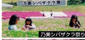
乃美シバザクラ祭り