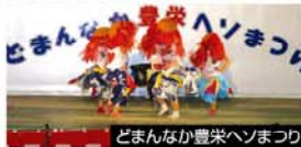
どまんなか豊栄ヘソまつり