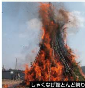
しゃくなげ館とんど祭り