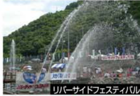
リバーサイドフェスティバル